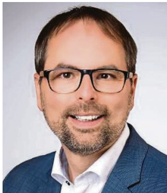
Andreas Magg Erster Bürgermeister

Zwischen Feurs und Olching wurden in den vergangenen 60 Jahren Brücken der Freundschaft gebaut - und ich freue mich, dass auch ganz greifbar die neue Toni-März Brücke nach genau acht Wochen Bauzeit pünktlich zu unserem Volksfest fertiggestellt werden konnte. Die Brücke verbindet die beiden Stadtteile Olching und Esting und bietet insbesondere für Radfahrer und Spaziergänger