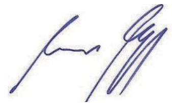
Andreas Magg Erster Bürgermeister