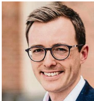
Maximilian Gigl, Zweiter Bürgermeister.

Erfreulich ist zudem, dass wir trotz des vielerorts drastischen Personalmangels beim Kitapersonal allen einjährigen Olchinger Krippenkindern ein Platz anbieten konnten. Wenige Kinder stehen noch auf der Warteliste (Gastkinder oder zum Aufnahmezeitpunkt U1), diese können ggf. unterjährig nachrücken. Fast allen Kindern, die zum Aufnahmezeitpunkt drei Jahre alt sind, konnte ein Platz im Kindergarten angeboten werden. Familien, die sich nachträglich angemeldet haben sowie Kinder, die erst nach dem Stichtag Geburtstag haben oder auf einen Platz in der Wunscheinrichtung warten, werden noch